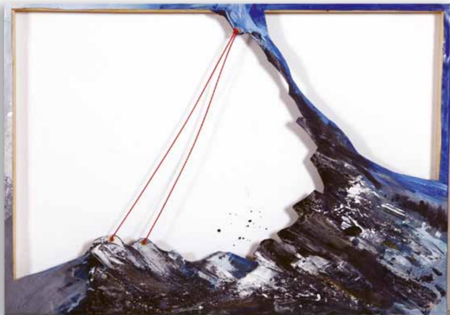
Seilschaft 50 x 60 cm