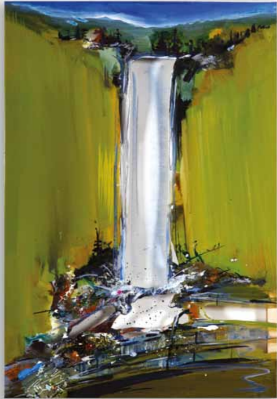
Kleiner Wasserfall 70 x 50 cm