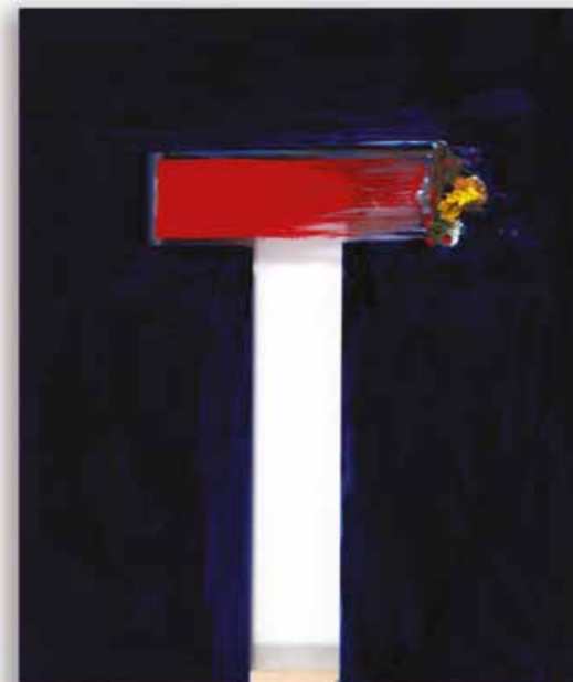
Sackgasse 60 x 50 cm