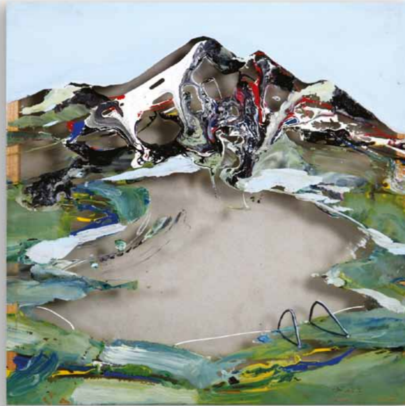
Albsee 30 x 30 cm