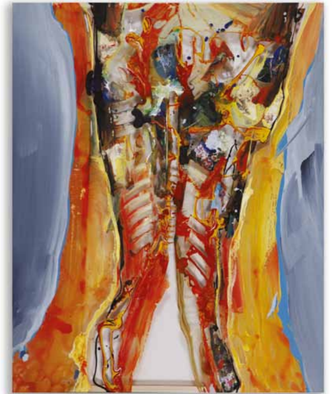
Innenleben 100 x 80 cm