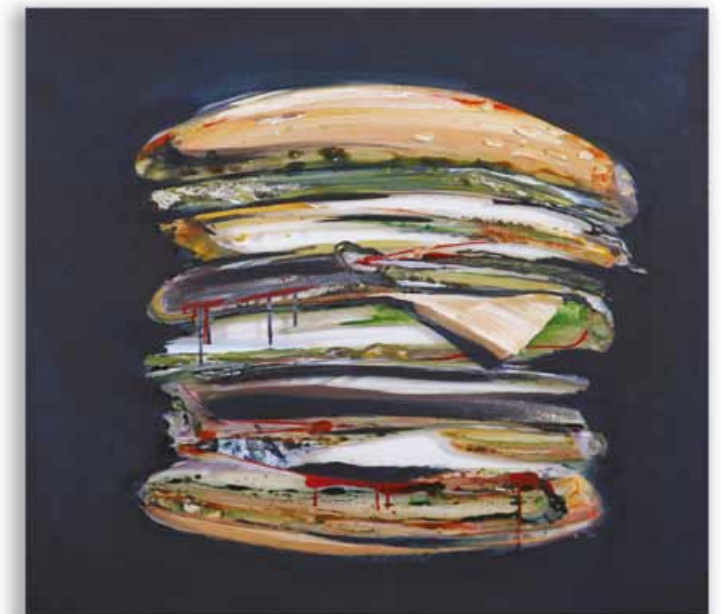
Fastfoodlandschaft 100 x 100 cm